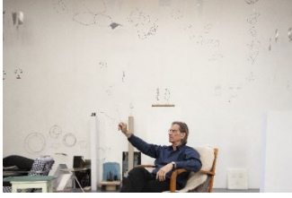
Markus Raetz in seinem Atelier an der Laubeggstrasse, Bern, 2011